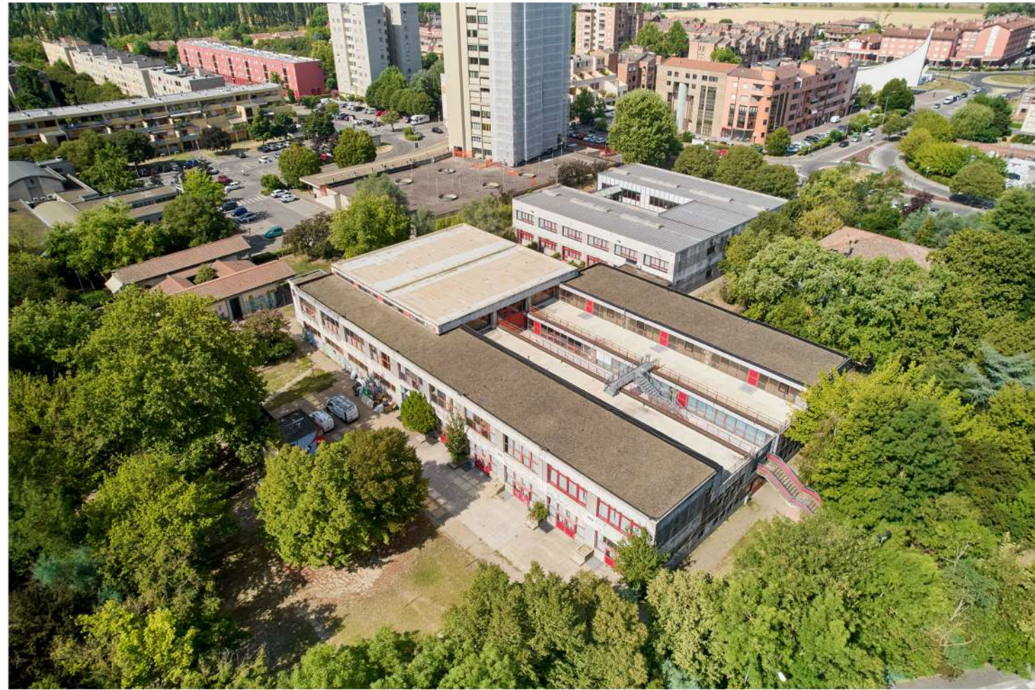
Foto aerea 3