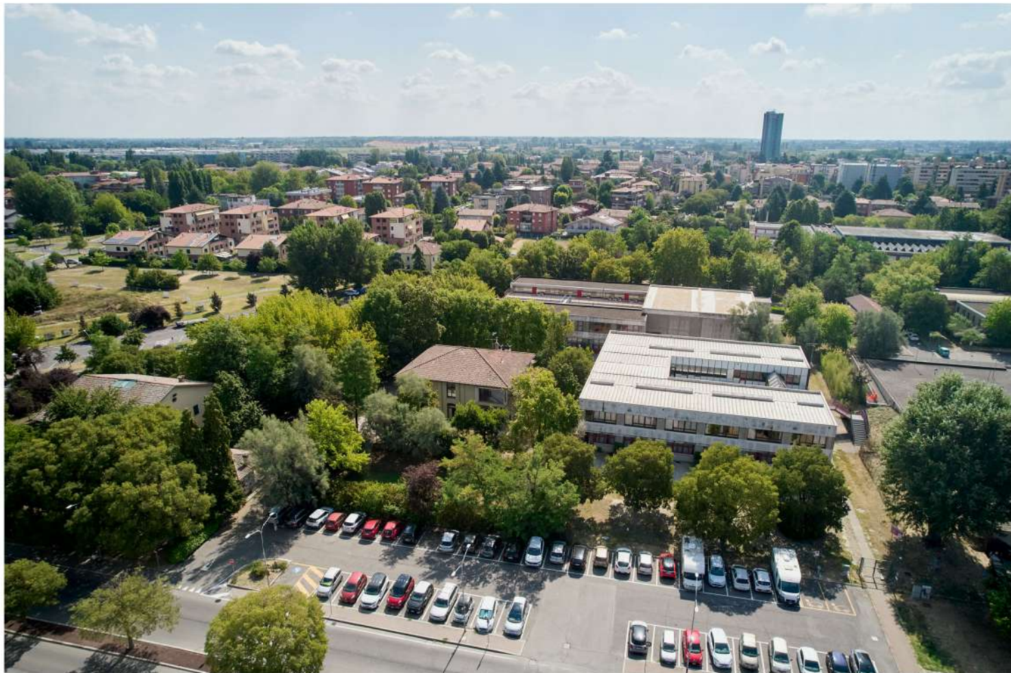
Foto aerea 6

Planimetria generale con indicazione dei coni fotografici