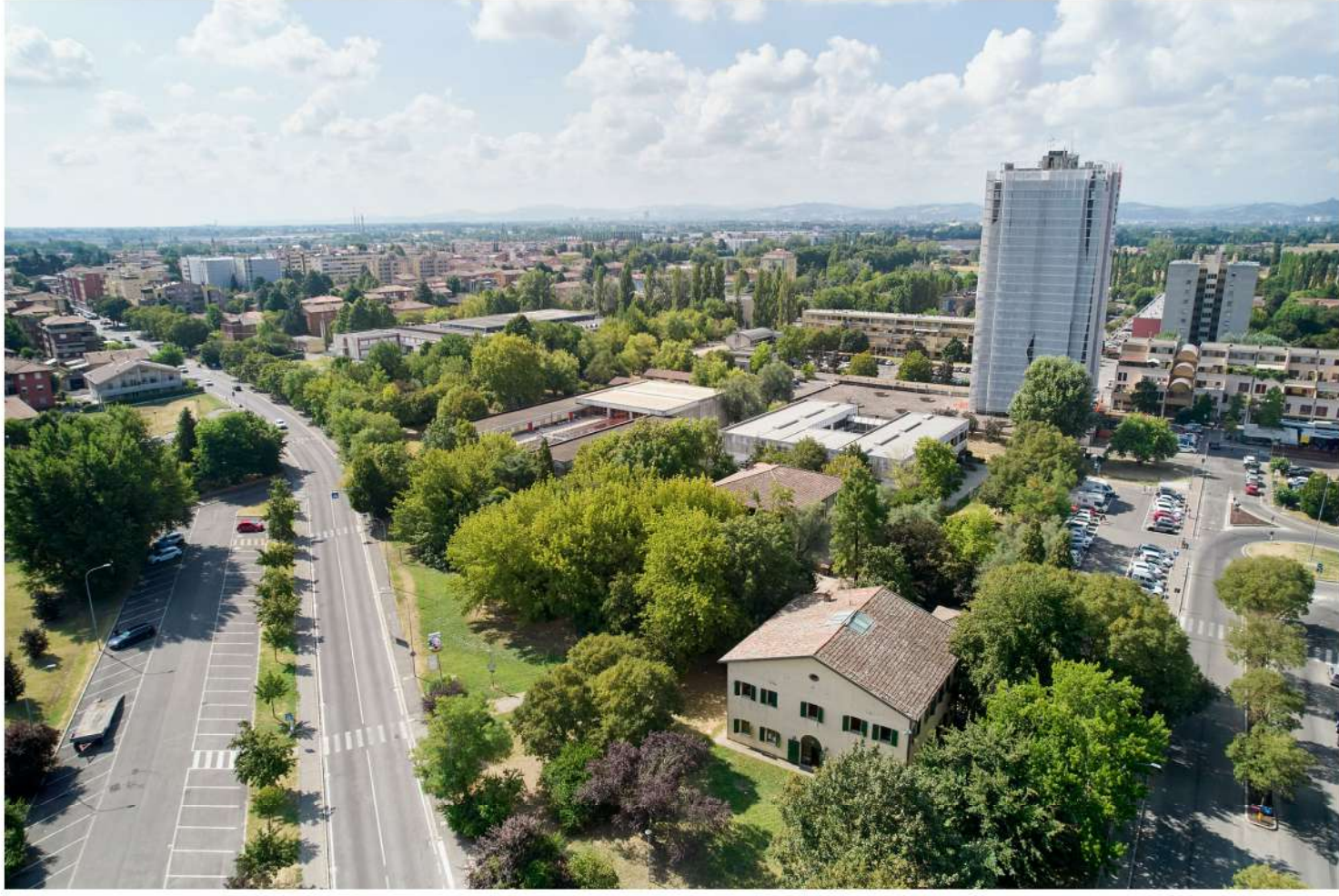
Foto aerea 1