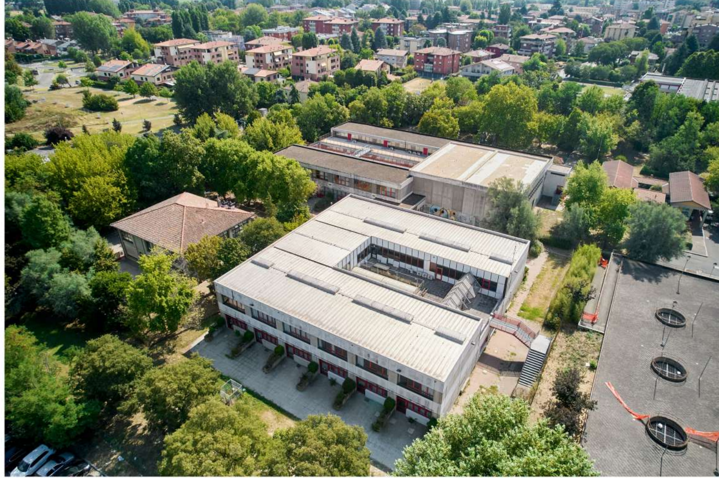
Foto aerea 2