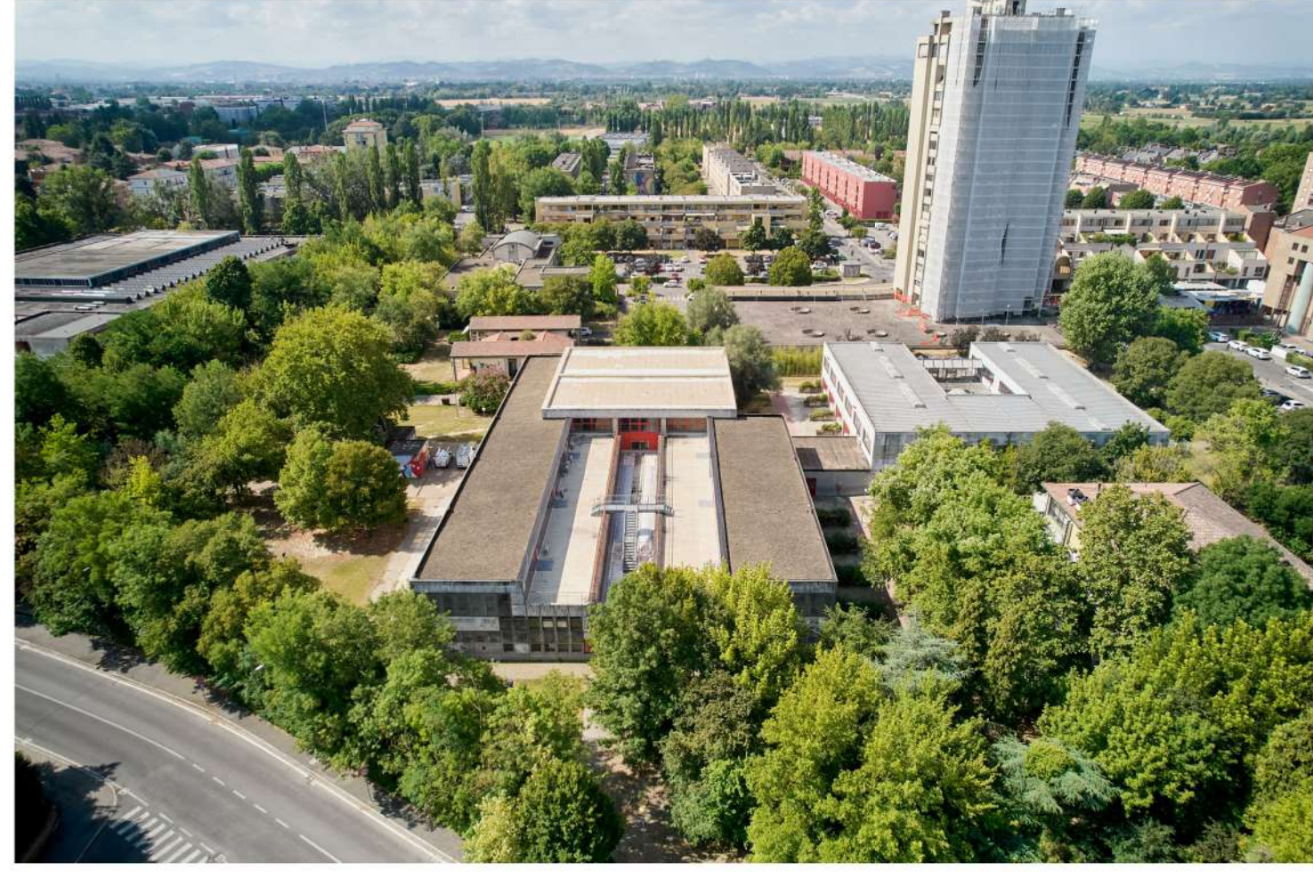
Foto aerea 5