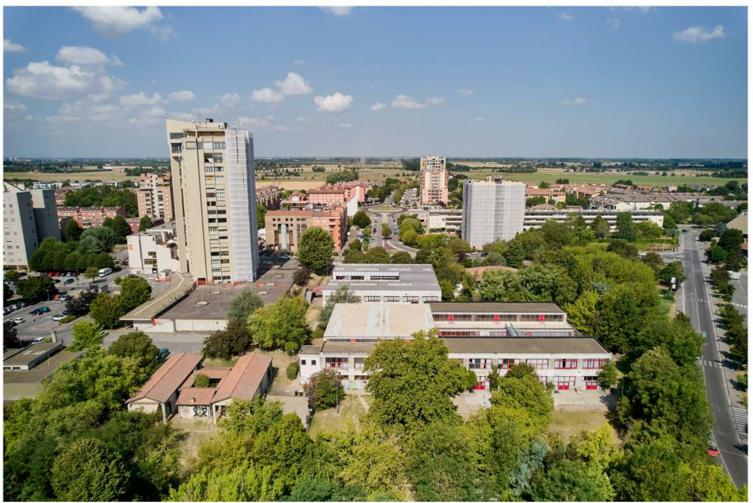
Foto aerea 4